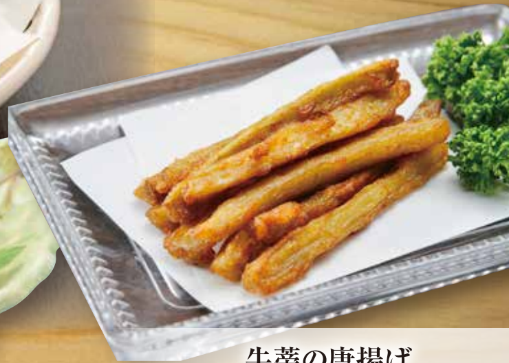
牛蒡の唐揚げ 乳 卵 小麦 700円