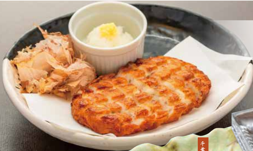
さつま揚げ 小麦 750円