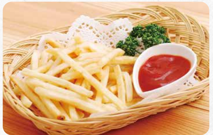
ポテトフライ..... 700円 小麦