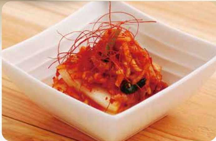
白菜キムチ..... 700円 海老