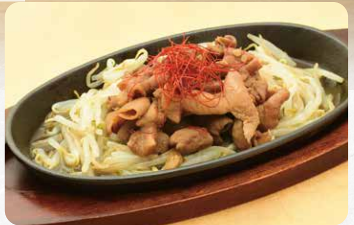
モツ炒め..... 800円 小麦