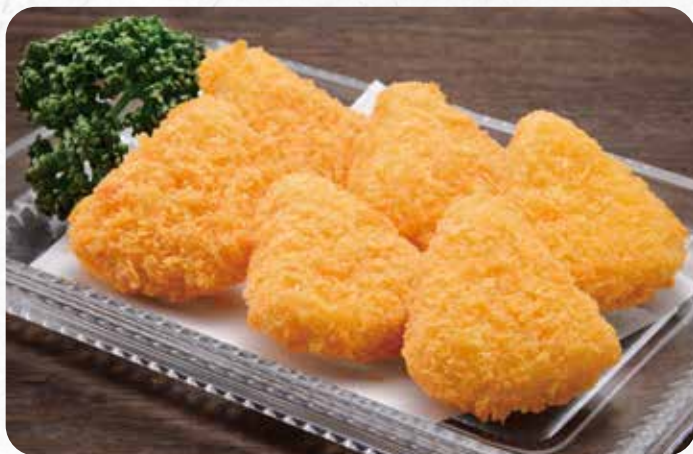
チーズフライ..... 800円 小麦 卵 乳